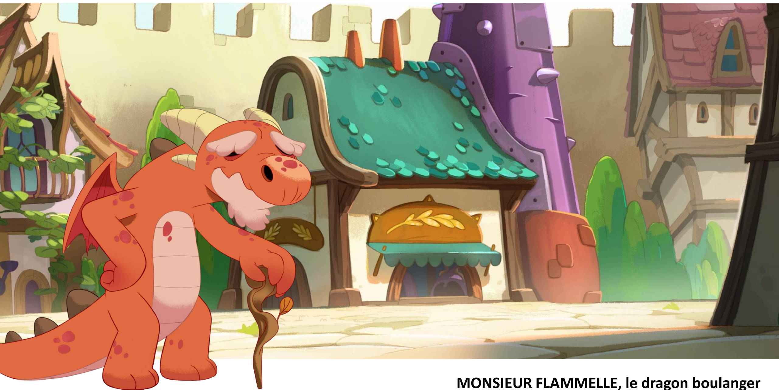
MONSIEUR FLAMMELE, le dragon boulanger